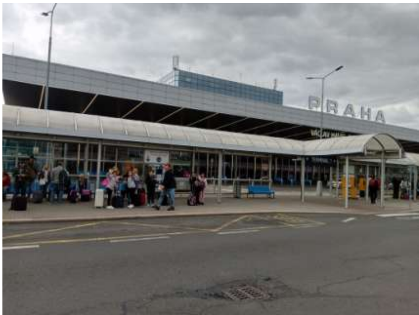
Εικόνα 1. Από τη μετακίνηση μαθητών του σχολείου μας στην Τσεχία

στ) μετακινήσεις μαθητών/τριών και συνοδών εκπαιδευτικών στο εξωτερικό πραγματοποιούνται στο πλαίσιο εκπαιδευτικών προγραμμάτων και ανταλλαγών και φιλοξενίας ειδικών φορέων εντός του σχολικού έτους.